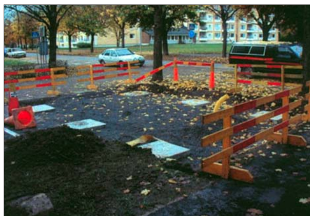
Tryckutjämningsplattor för väggmontage