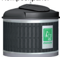
Night sky black