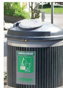
Liggande läsbar aluminiumlucka