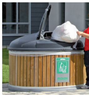
Liggande polyetenlucka finns i öppningar från 170 mm till 600 mm