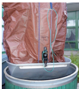
Lyftsäck med bottenkål