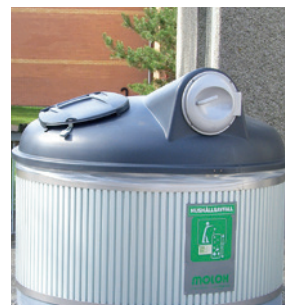
Stående aluminiumlucka och liggande polyetenlucka