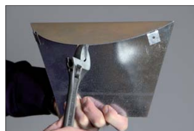
Art nr 8020-01 Förminskningsplåt. De 3 fästvinklarna bockas 90° före montage. Monteras med plåtskruv eller popnit.