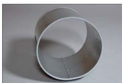
Art nr 8020-300 Väggenomföring. Ø300mm, längd 300mm.