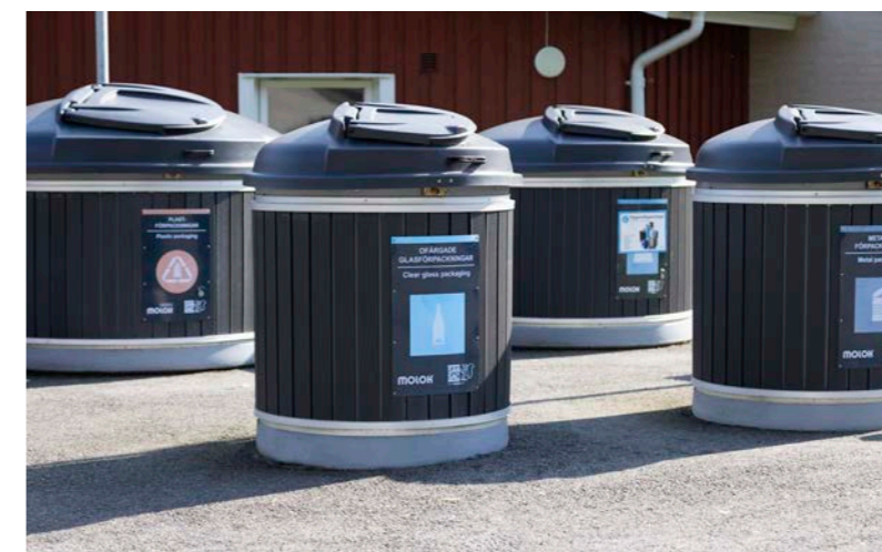
Samtliga Molok Classic i sorteringsstationen har underhållsfri kompositpanel

det enklare att hålla prydligt runtomkring, jämfört med ytan i ett trångt soprum, menar han.